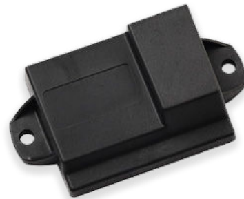
MiBlock Active Tag

Optional: In Verbindung mit dem Mi50 und unserem Security-Portal wird eine Steuerung aus der Ferne oder über unsere MiApp möglich.